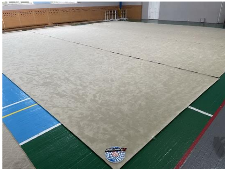
Проект № 764 «Створення умов для навчально – тренувального процесу на відділенні художньої гімнастики ДЮСШ 13 Київ», Просп. Оболонський, 28-г