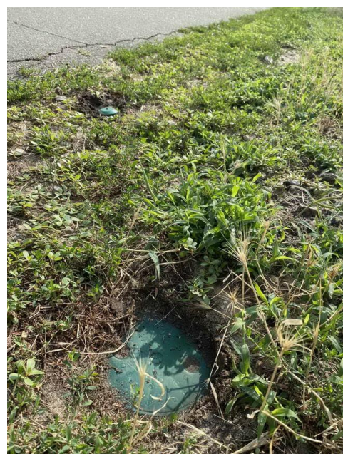
Проект № 966 «Продовження робіт зі створення скверу на вулиці Озерній» вул. Озерна, 20