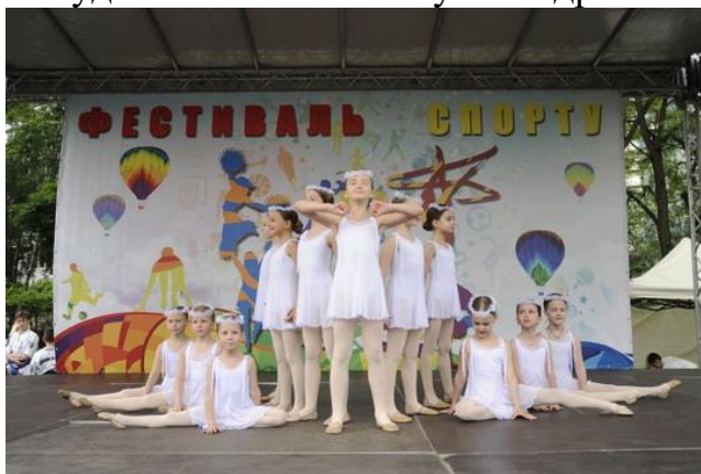
Проект № 144 «Фестиваль спорту», Оболонський район