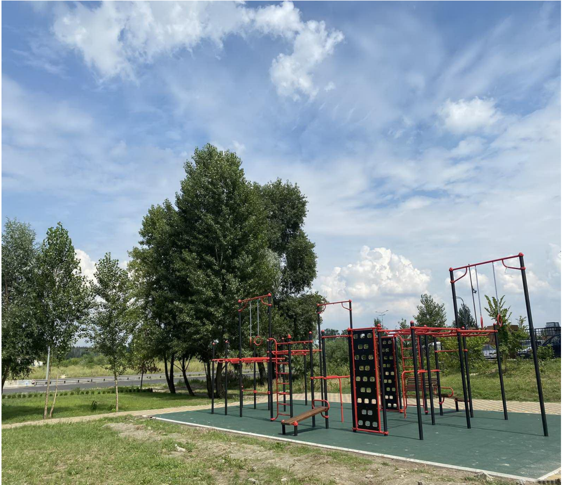
1139 «Благоустрій території між будинками 5 та 7 по вул. Кондратюка в Оболонському районі»

Також у I півріччі 2021 року було організовано супровід 108 проєктів громадського бюджету-2022, запропонованих мешканцями Оболоні до реалізації. Після проведення експертизи проєктів відповідальними структурними підрозділами Оболонської райдержадміністрації 80 проєктів було допущено до голосування, 9 проєктів відхилено, 19 проєктів видалено із електронної системи громадського бюджету їх авторами. Таким чином, 80 проєктів може бути проголосовано мешканцями починаючи з 17 серпня 2021 по 15 вересня 2021. Серед запропонованих проєктів багато таких, які направлені на зміцнення матеріально-технічної бази установ освіти: придбання комп'ютерів, оргтехніки, ремонт та оновлення шкільних бібліотек та харчоблоків. Також є проєкти по благоустрою шкільних двориків та прибудинкових територій наших дворів, по організації дозвілля мешканців Оболоні та всієї столиці, через культурні та спортивні фестивалі та багато інших цікавих ідей. Тому запрошуємо всіх присутніх ознайомитися з запропонованими проєктами на сайті громадського бюджету та прийняти активну участь в їх голосуванні.