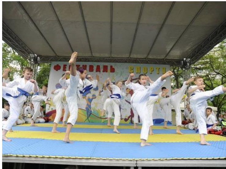
Проект № 144 «Фестиваль спорту», Оболонський район