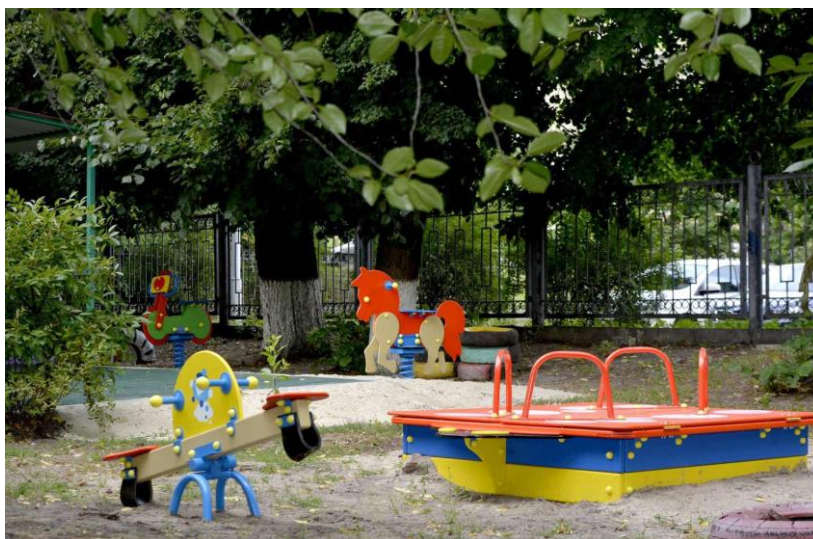
Проект № 632 «Сучасні дитячі майданчики в дитячому садку «Півник» № 448», вул. Вишгородська, 52 А

Крім цього, у 2019 році було супроводжено 237 проєктів громадського бюджету, запропонованих мешканцями столиці, серед яких 63 стали проєктами – переможцями на загальну суму 20 370,1 тис. грн. З них виконавцями 37 проєктів на суму 15966,7 тис. грн. буде управління освіти Оболонської районної в місті Києві державної адміністрації, виконавцями 22 проєктів на суму 2423,7 тис. грн. буде управління житлово – комунального господарства Оболонської районної в місті Києві державної адміністрації, виконавцями 4 проєктів на суму 1979,7 тис. грн. буде управління будівництва, архітектури та землекористування Оболонської районної в місті Києві державної адміністрації. Реалізовуватись проєкти будуть у 2020 році.