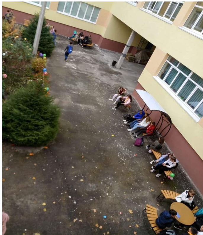
Проект № 792 «Відкритий простір школи № 285 «Open space», вул. Полярна, 8-В