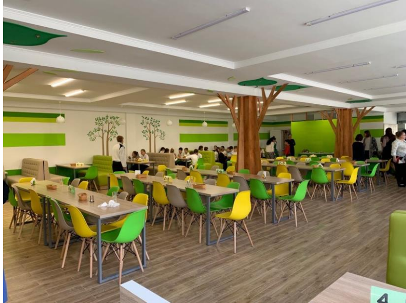
Проект № 48 «Сучасна їдальня в НВК « 240 «Соціум»», проспект Героїв Сталінграда, 39 Г