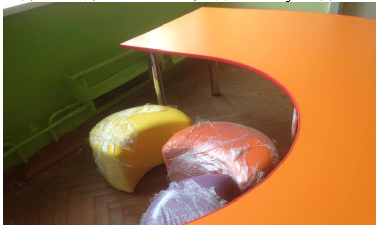
Проект № 1118 «Цікавий простір школи № 285 , вул. Полярна, 8-В»