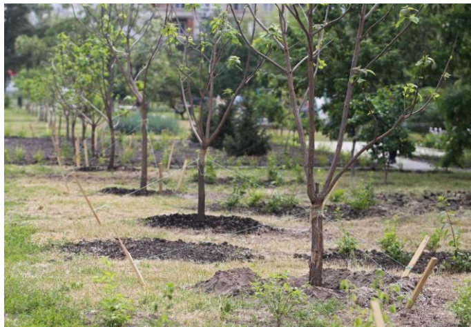
Проект № 513 «Створення скверу на вул. Озерній»