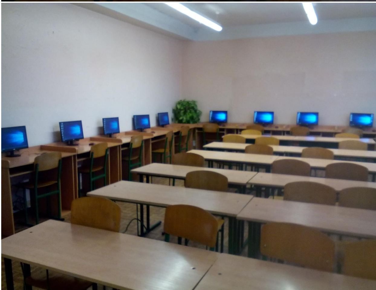
Школа I - III ступенів №226 Оболонського району м. Києва