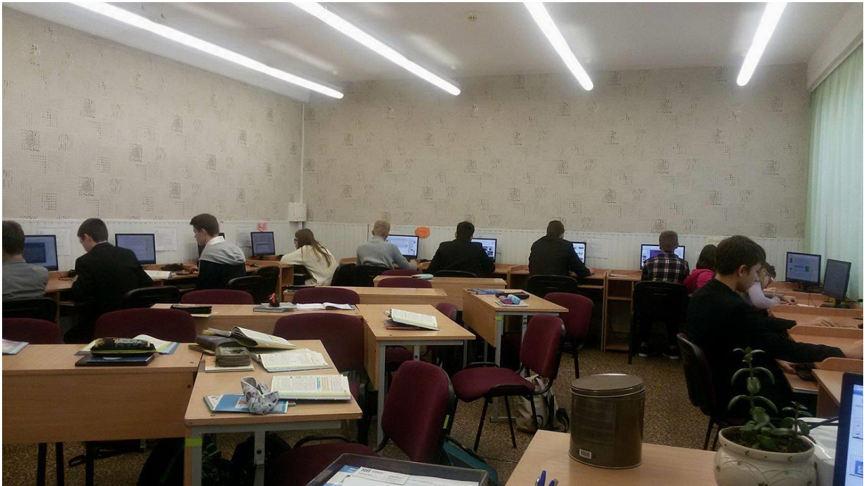
Школа I - III ступенів №219 Оболонського району м. Києва